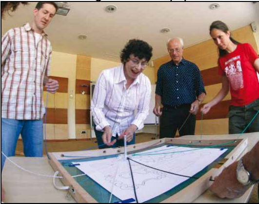
Navegador de Equipo